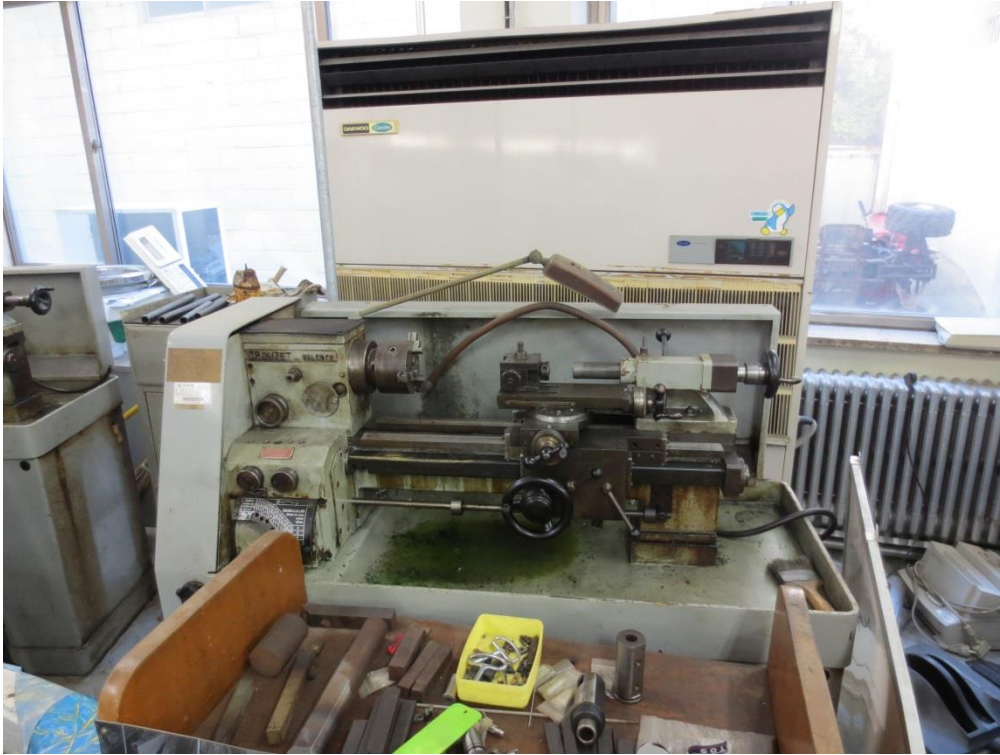
매각B 1)동관 기계공작실

* 아래의 사진은 참조용이며 매각품목 및 수량은 현장설명회에서 직접 확인 하여야 함.