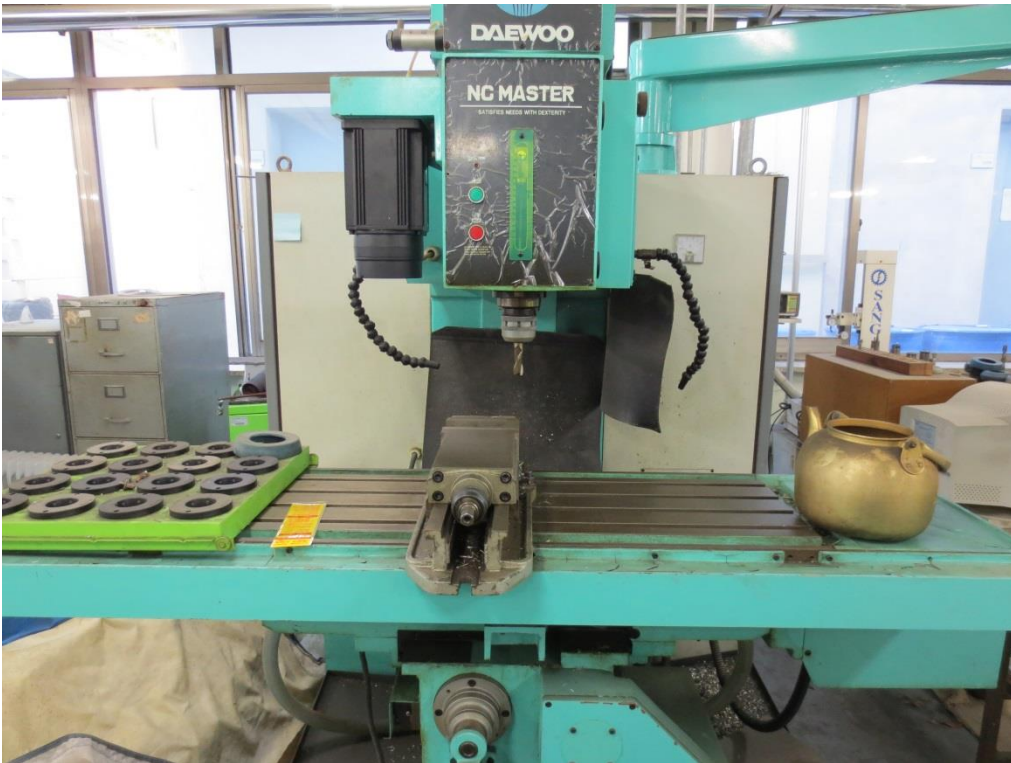
매각B 6)동관 기계공작실