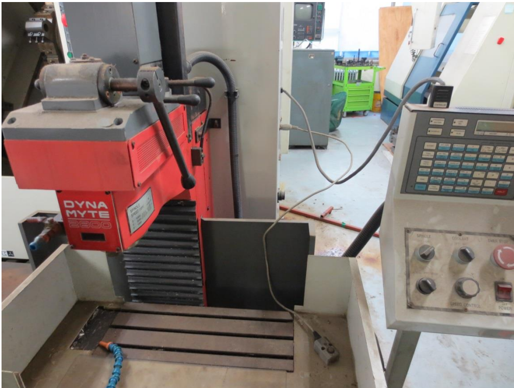
매각B 10)동관 기계공작실