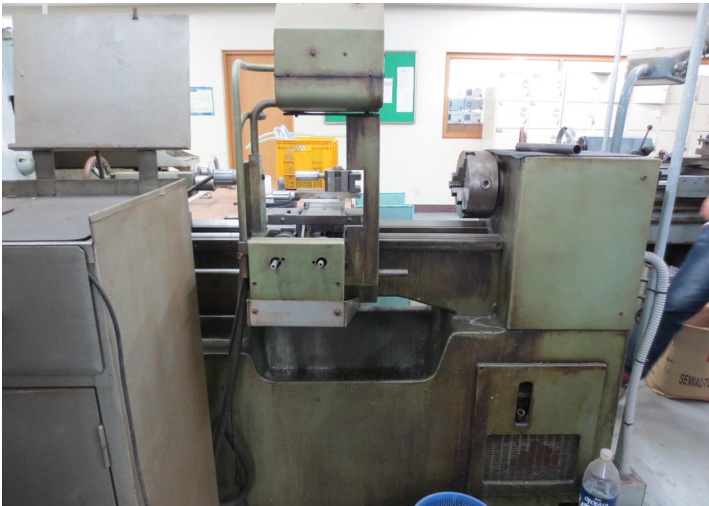
매각B 2)동관 기계공작실