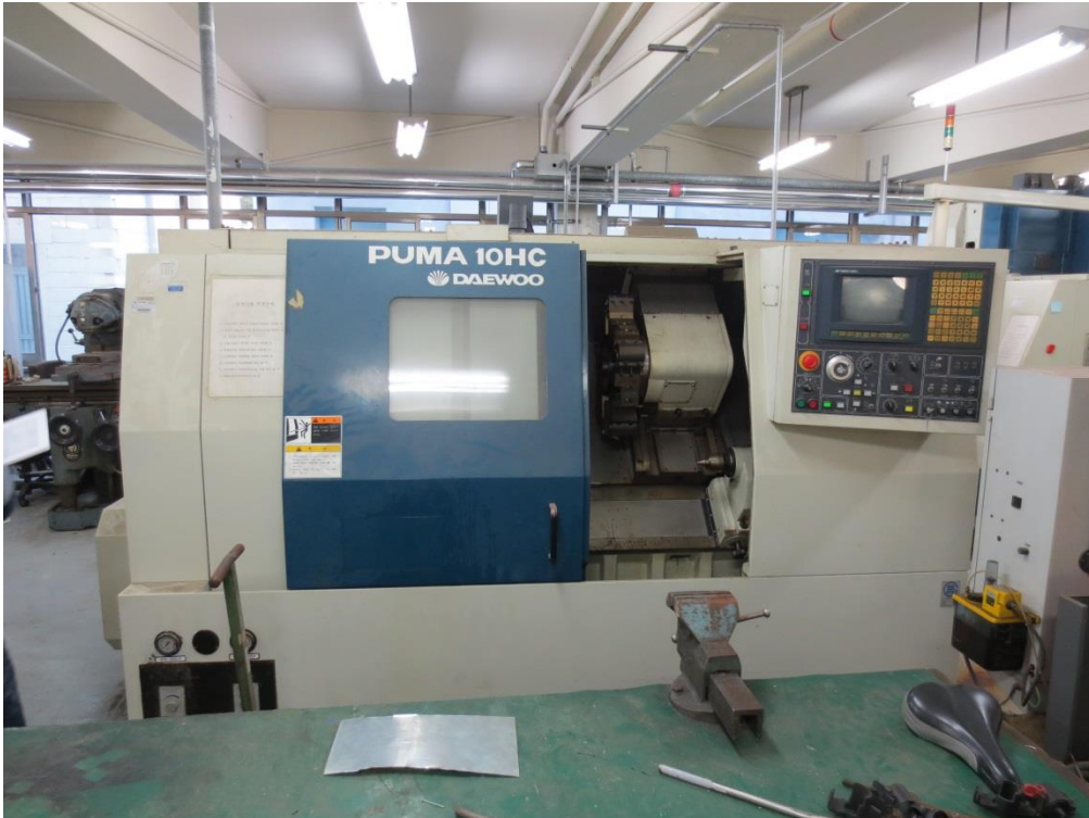
매각B 4)동관 기계공작실