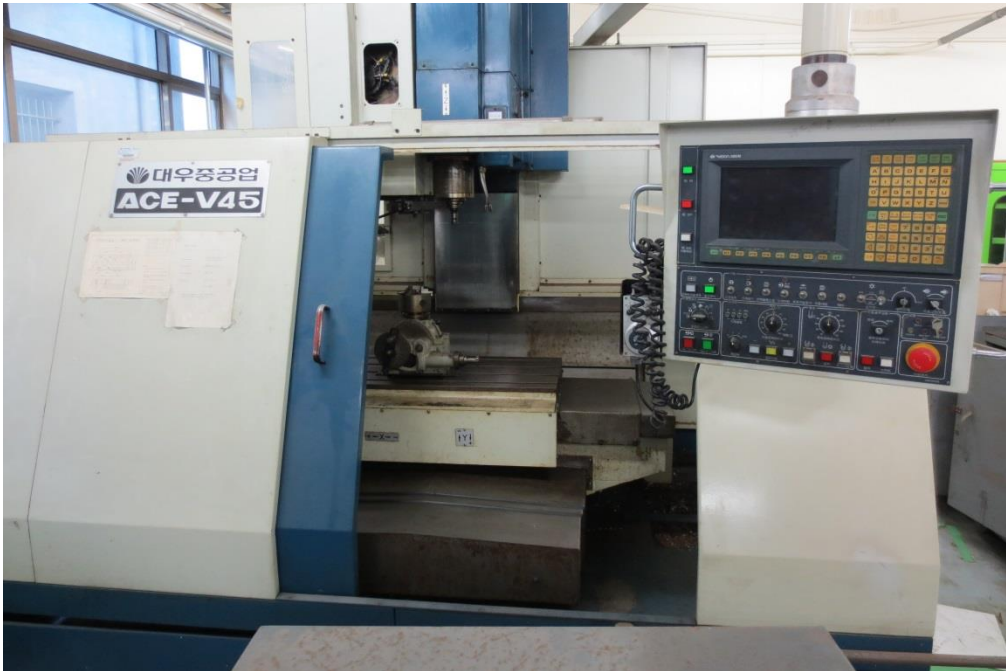
MACHINING CENTER(V-MCT) ACE-V45