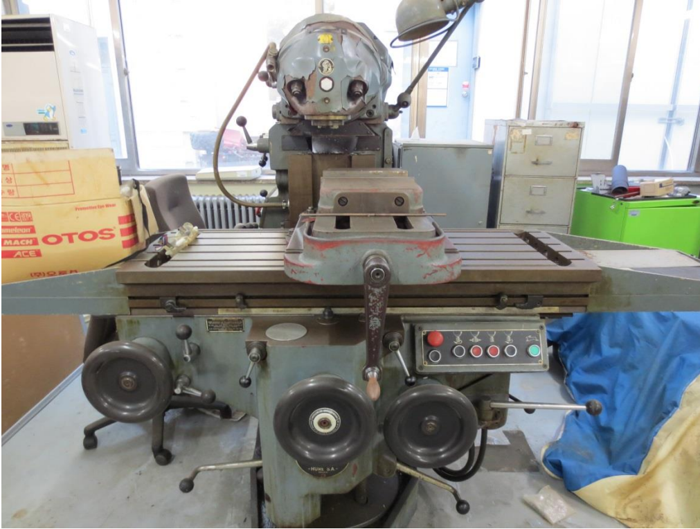
매각B 5)동관 기계공작실