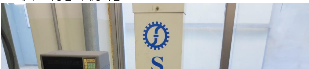
매각B 9)동관 기계공작실